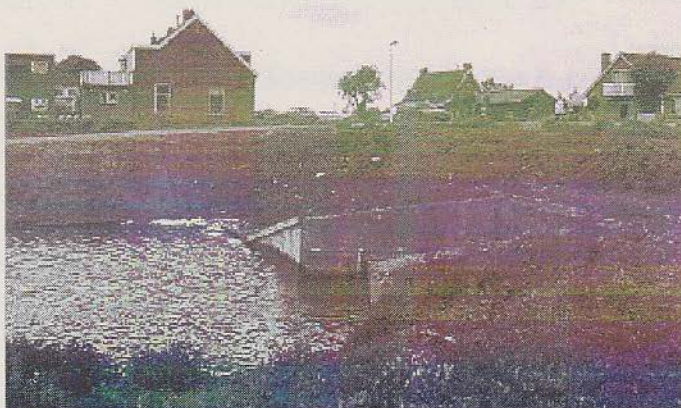
Afbeelding 2. Duiker bij de Dwarskade

Op de kaart zien we dat de polder Vrijenban loopt van Delft richting Nootdorp tot de Dwarswetering. Vanaf Delft is het eerste stuk tot de Middelweg bij de letters BAN "op de kaart niet zichtbaar" sportpark en het recreatiepark het Hertenkamp. Het stuk dat bouwrijp werd gemaakt loopt van de Middelweg tot de Dwarskade. De Dwarskade ligt een stuk hoger dan de Vrijenban polder en loopt parallel met de eveneens hoger gelegen Dwarswetering. Door de graafwerkzaamheden kon je zien aan de grote hoeveelheden scherven dat de Dwarskade was opgehoogd met stadsvuil. Het was dan ook daar waar ik de meeste pijpvondsten heb gedaan bij de duiker van de Dwarskade die we zien op afbeelding 2.